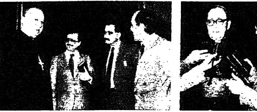
السفير اليابوي ■ الابائي نعيان يتحدث الى الصحفيين ■